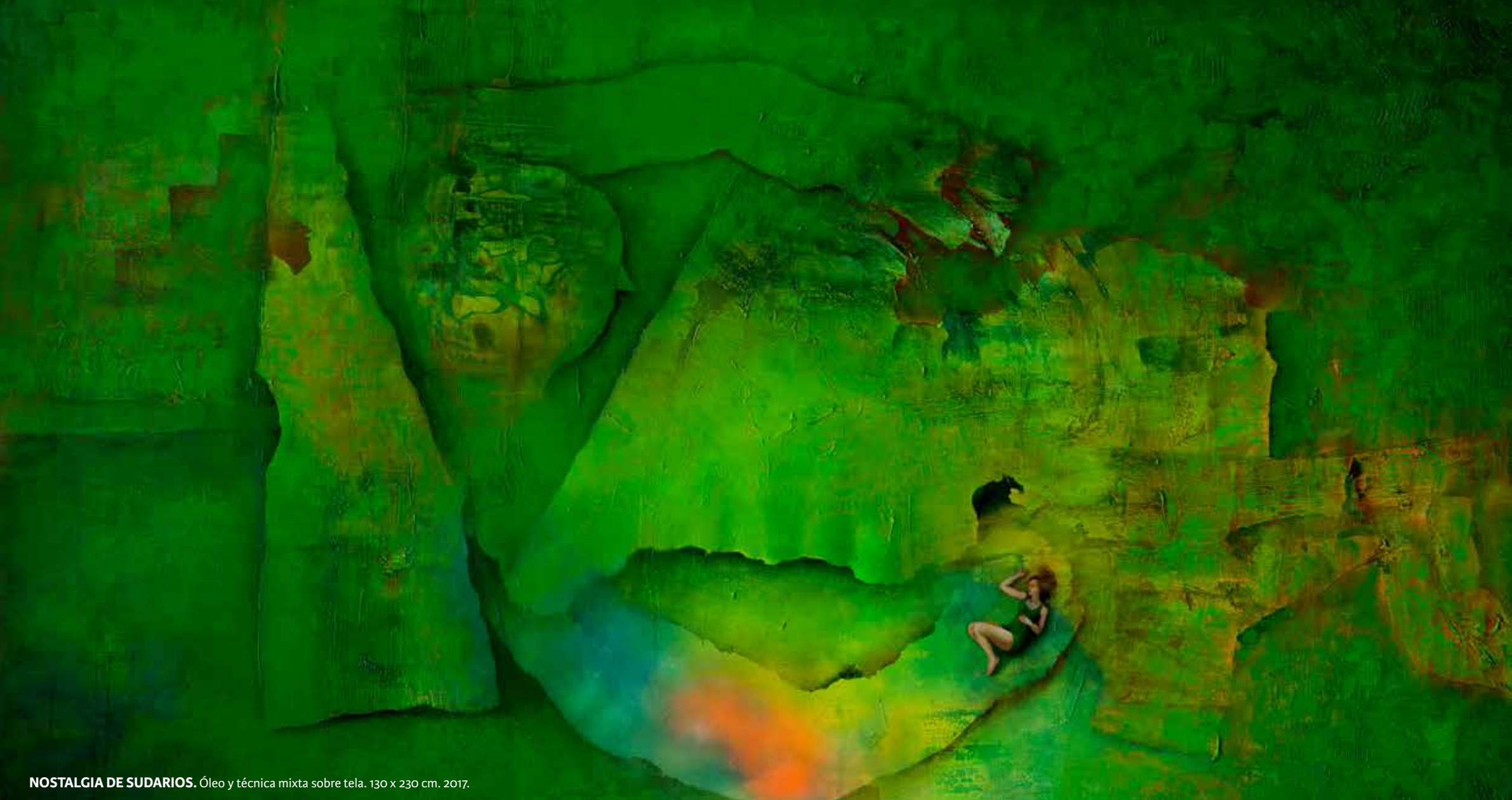
NOSTALGIA DE SUDARIOS. Óleo y técnica mixta sobre tela. 130 x 230 cm. 2017.