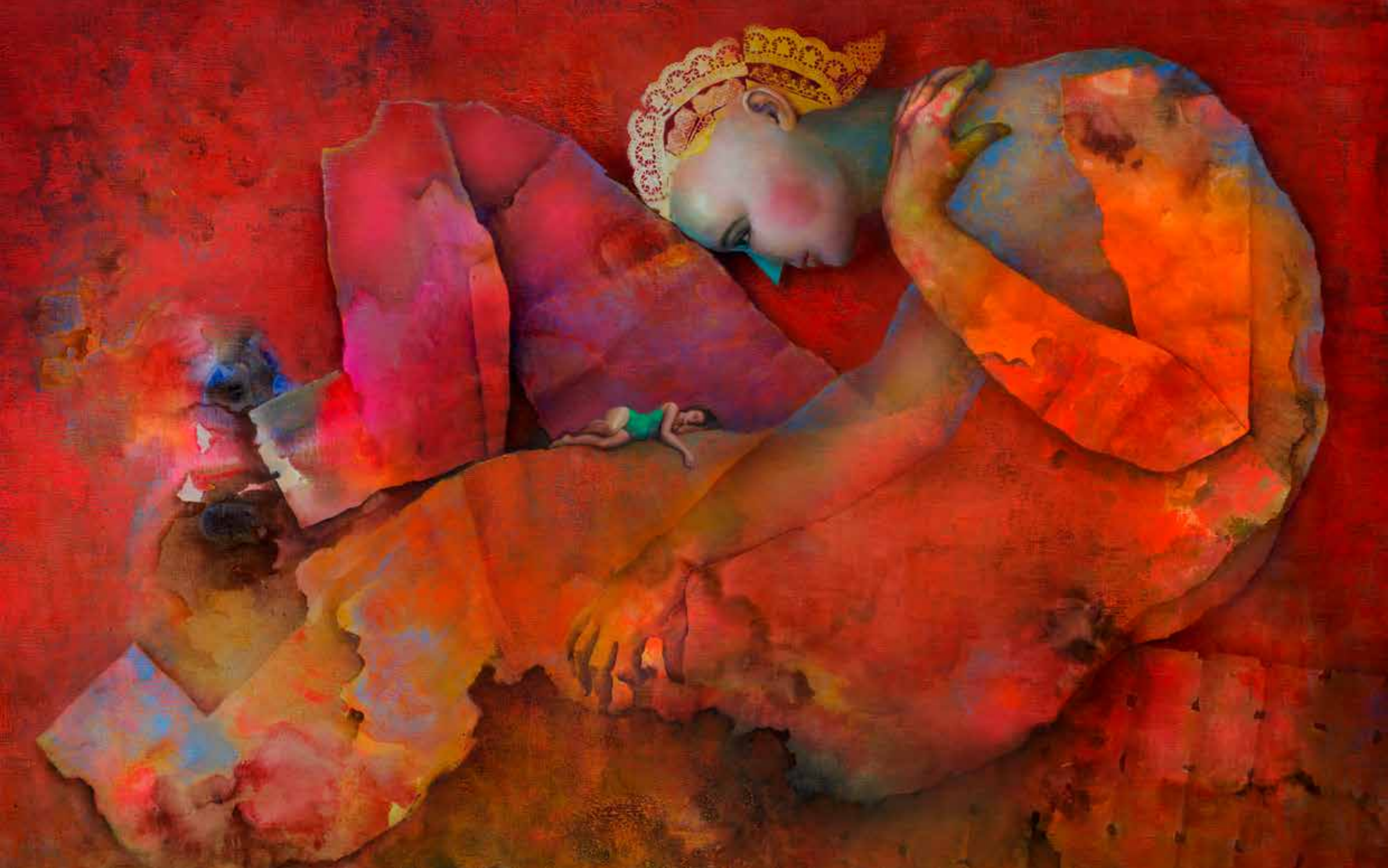
TIERRA Y NOCHE Óleo y técnica mixta sobre tela 127 x 190 cm 2017