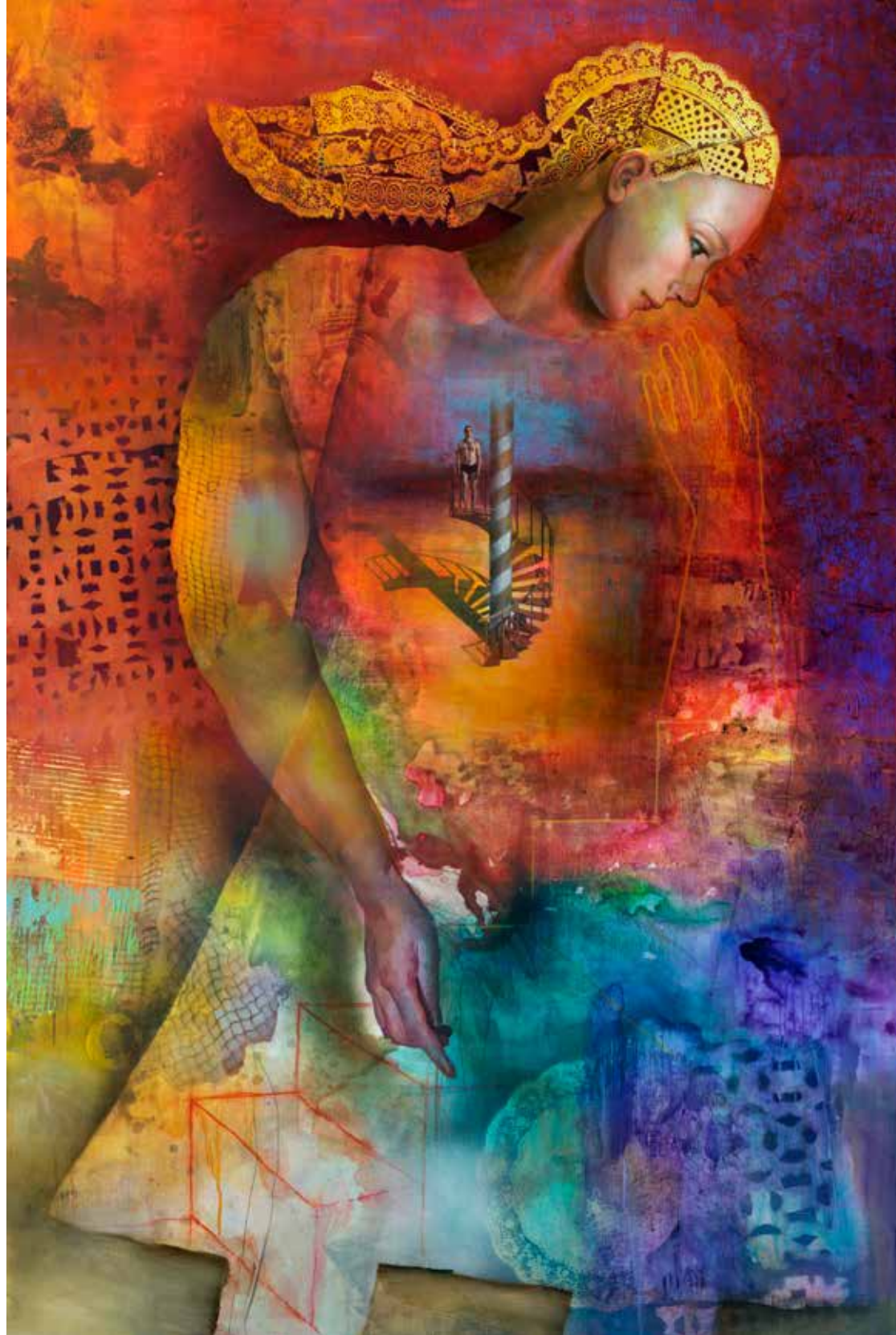
EL CAUCE MUDO Óleo y técnica mixta sobre tela 190 x 127 cm 2017